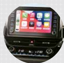
RADIO TÁCTIL 9" Con 6 bocinas, Android Auto y Apple CarPlay con conexión inalámbrica.