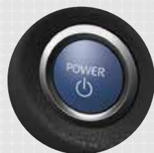
SMART ENTRY Con botón de encendido