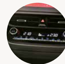
AIRE ACONDICIONADO Con climatizador de doble zona