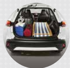
PORTAEQUIPAJE Amplio espacio de almacenamiento de 440L