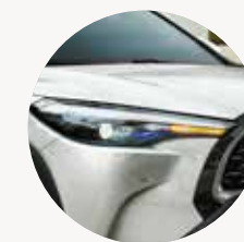
FAROS DELANTEROS Bi-LED con luces diurnas y neblineros LED