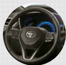
VOLANTE EN CUERO Con controles de audio, teléfono y configuración