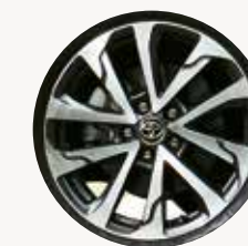
AROS DE ALEACIÓN DE LUJO 18 pulgadas